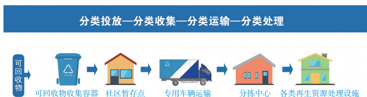
图 4-11 可回收物的去向

厨余垃圾，又称湿垃圾，这些湿垃圾（投放湿垃圾时记得要去去除包装袋）被投放到设置在居住区公共区域的湿垃圾收集容器后，由小区物业保洁员短驳至垃圾箱房，再由环卫使用湿垃圾专用收集车辆将其收运至湿垃圾资源化利用企业，实现日产日清。郊区主要通过“就地就近、一镇一站”的湿垃圾处理设施和分散设备进行资源化利用，如图 4-12 所示。