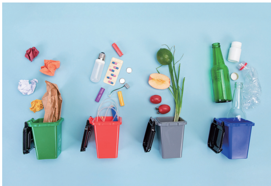
图 4-5 垃圾分类示意

分类搬运，从而将垃圾转变成公共资源的一系列活动的总称（图 4-5）。分类的目的是提高垃圾的资源价值和经济价值，力争物尽其用。进行垃圾分类收集可以减少垃圾处理量和处理设备，降低处理成本，减少土地资源的消耗，具有社会、经济、生态等几个方面的效益。