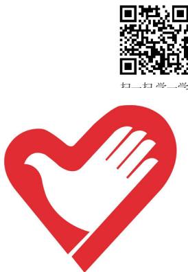
图 4-15 中国青年志愿者标志（“心手标”）

志愿服务主要是指社会志愿组织（图 4-15）或个人在无偿服务的前提下，通过自愿或在社会志愿组织的组织下积极投身于社会公益事业，充分发挥自身的知识、技能、体力、财富等优势以促进社会公益事业的发展，同时提升自身的思想道德水平。随着志愿服务的不断深入和发展，大学生志愿者为志愿者群体注入了新的血液，成了志愿者组织的重要组成部分。大学生志愿服务主要指高校的在校大学生能够自觉自愿参加学校志愿组织或社会志愿组织，用自己掌握的专业知识与技能，以自身发展为目的，无偿地为推动人类社会的进步而展开的各种服务活动。