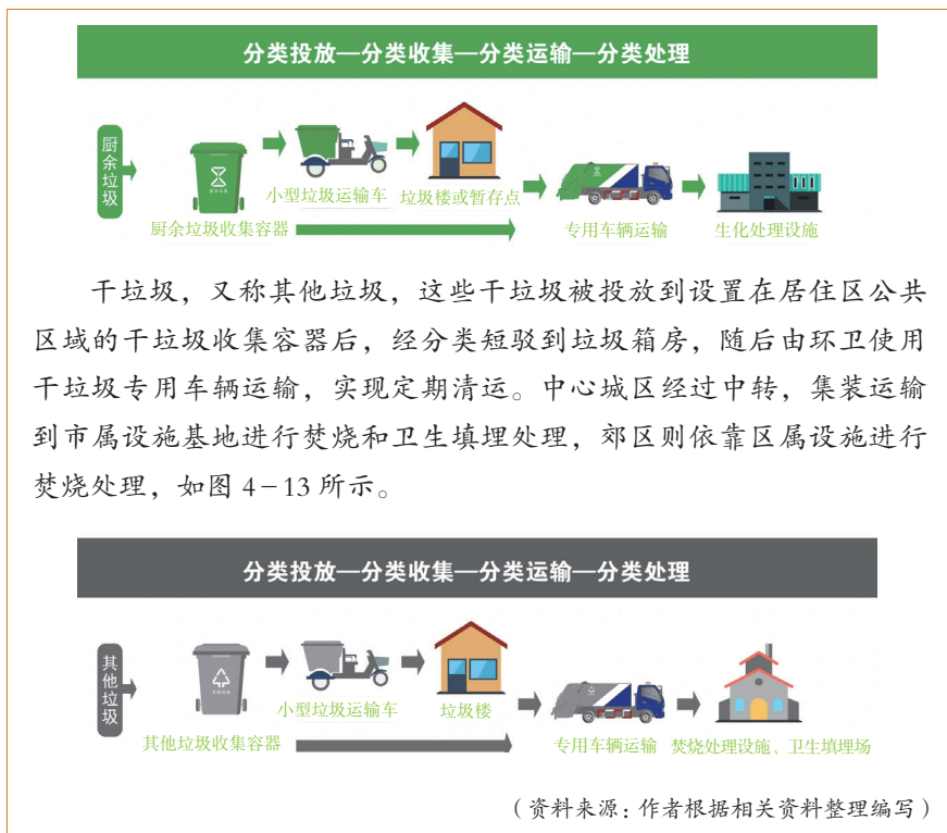
图 4-12 厨余垃圾的去向