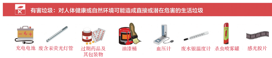
图 4-7 有害垃圾图标及示例