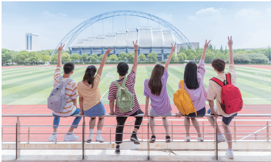
图 4-4 营造良好校园环境，人人有责

是育人的方式，是展示校园文化的窗口。良好的校园环境会带给同学们朝气蓬勃、生机盎然、赏心悦目的感觉，美丽和谐的校园环境是润物细无声的、催人上进的，能够陶冶情操、启迪心灵，直接影响到校园的文化氛围（图 4-4）。