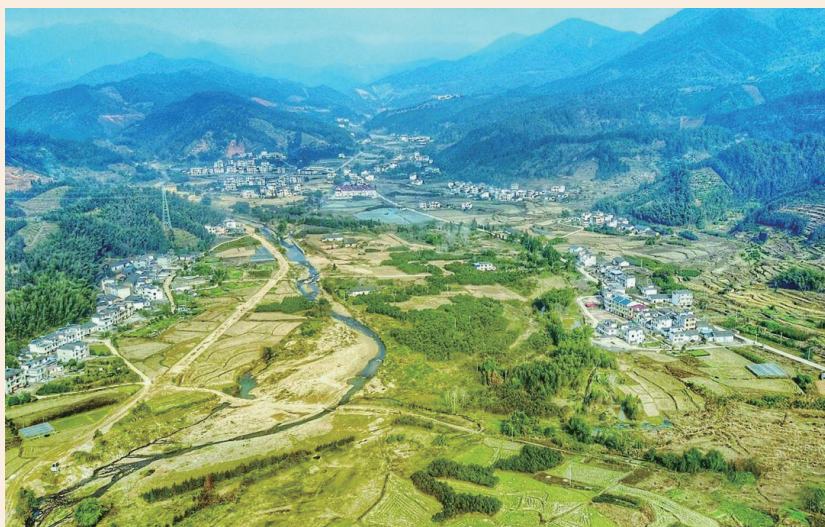
图 4-14 崇义县铅厂镇义安村