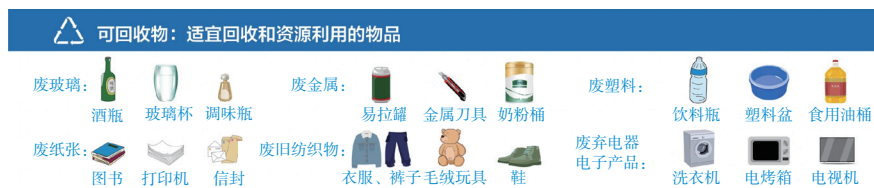
图 4-6 可回收物图标及示例