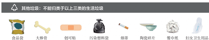
图 4-9 其他垃圾图标及示例

其他垃圾也是不可回收垃圾。图标也是一个三角形，不过只有两个箭头，而且箭头都朝下，如图 4-9 所示。