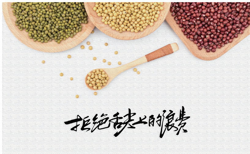
图 4-2 拒绝舌尖上的浪费

中央要求厉行勤俭节约、反对铺张浪费（图 4-2），得到了广大干部群众的衷心拥护。后续工作要不断跟上，坚决防止走过场、一阵风，切实做到一抓到底、善始善终。抓而不紧、抓而不实、抓而不常，等于白抓。一段时间以来，社会各方面就此积极建言献策，不少意见值得重视。要梳理采纳合理意见，总结我们自己的经验教训，借鉴国内外有益做法。下一步，关键是要抓住制度建设这个重点，以完善公务接待、财务预算和审计、考核问责、监督保障等制度为抓手，努力建立健全立体式、全方位的制度体系，以刚性的制度约束、严格的制度执行、强有力的监督检查、严厉的惩戒机制，切实遏制公款消费中的各种违规违纪违法现象。