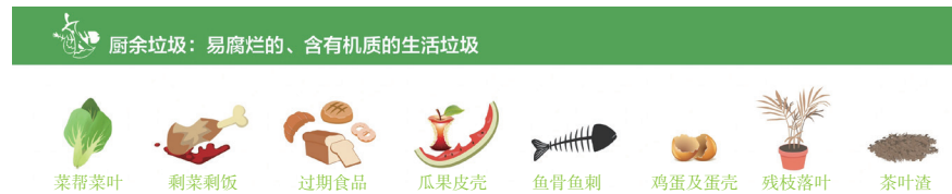
图 4-8 厨余垃圾图标及示例