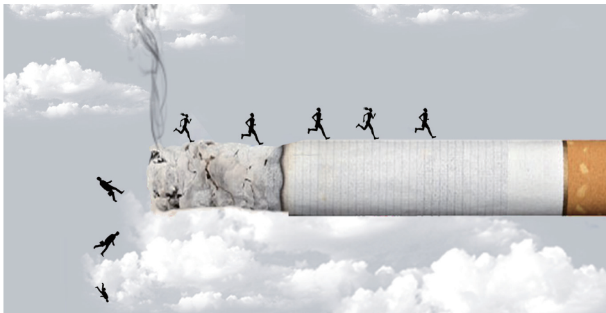
图 4-3 吸烟有害健康

当然，对于吸烟的危害，最直接的还是影响到大学生的身体健康（图 4-3）。根据德国科学家的一项最新研究表明，吸烟的人睡眠时间比不吸烟的人要少，并且睡眠质量也较差。这对大学生的健康造成了较大的影响，不利于大学生养成积极向上的生活习惯。