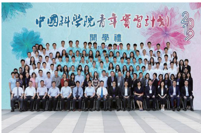
图 4-19 “中国科学院——香港青年实习计划”开学礼

实习过程中，香港大学生深入实验室开展动手实践，在导师团队的悉心指导下完成了多项成果。例如，有的同学利用多模态磁共振成像数据，完成了不同脑区和全脑尺寸的个体化的脑图谱绘制；有的同学利用深度学习构建了人机对抗的智力游戏；有的同学在实践中摸索研究方法及手段，寻找新的超导材料等。