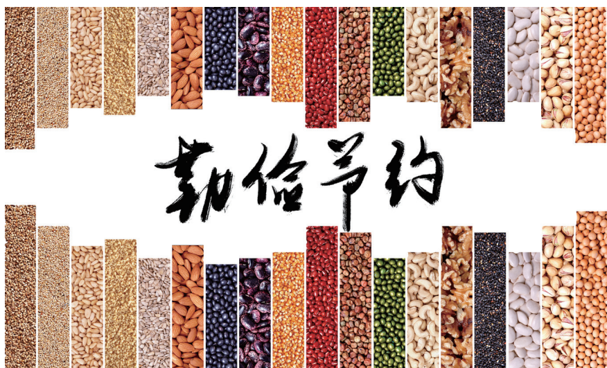
图 4-1 勤俭节约是中华民族传统美德

青年大学生作为“圆梦”新时代的建设者，是实现中国梦的栋梁。大学生树立勤俭节约的消费观是促进大学生树立勤俭节约意识、确保大学生健康成长的需要，进而推动全社会形成勤俭节约的文明风尚。加强社会主义精神文明、弘扬社会主义荣辱观，是实现中华民族伟大复兴中国梦的需要。作为新时代青年，只有大兴勤俭节约之风，自觉摒弃铺张浪费行为，才能带动社会大众牢固树立倡导节约、回归节俭的思想，形成良好的社会风气（图4-1）。