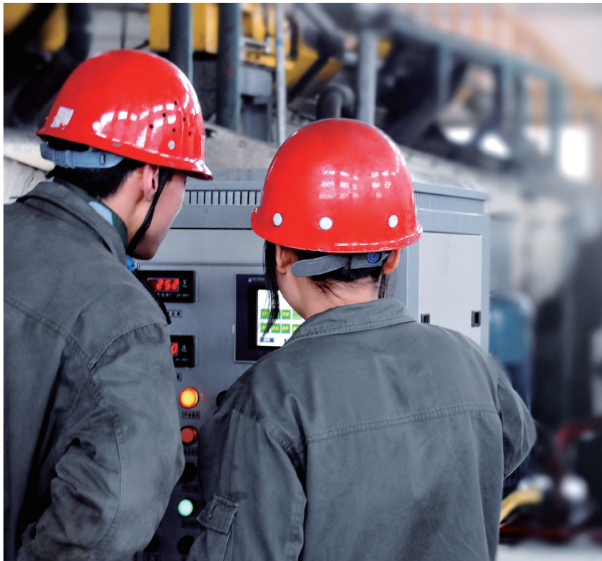
图 4-18 大学生在企业实习

己的职业规划有初步的想法，并且能够在企业环境里尽快转变身份。企业也需要吸收新鲜力量以提高技术水准，吸纳创新力量的融入。企业接纳学生实习，展示企业内涵，也是一种向社会宣传自己的方式。