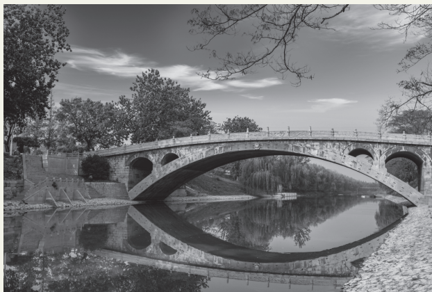
图 1-1 赵州桥

赵州桥（图 1-1）又称安济桥，坐落在河北省石家庄市赵县的洨河上，横跨在 37 米多宽的河面上，因桥体全部用石料建成，当地人也称其为“大石桥”。赵州桥建于隋朝年间公元 595—605 年，由著名匠师李春设计建造，距今已有 1 400 多年的历史，是当今世界上现存保存最完整的古代单孔敞肩石拱桥。赵州桥是古代劳动人民智慧的结晶，开创了中国桥梁建造的崭新局面。1961 年，它被国务院列入第一批全国重点文物保护单位；2015 年，它荣获石家庄十大城市名片之一。它在漫长的岁月中，即使经过无数次洪水冲击、风吹雨打、冰雪风霜的侵蚀和 8 次地震的考验，仍安然无恙，巍然挺立在洨河之上。