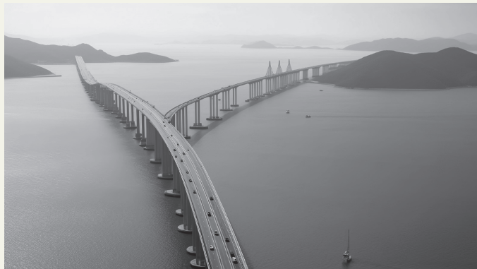
图 1-3 珠港澳大桥

汽车可免加签通行港珠澳大桥跨境段。2020年8月16日，港珠澳大桥口岸珠澳货运通道正式启用。