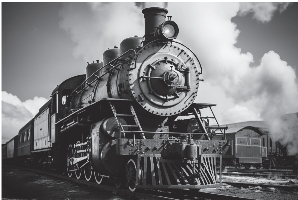
图 2-1 蒸汽火车