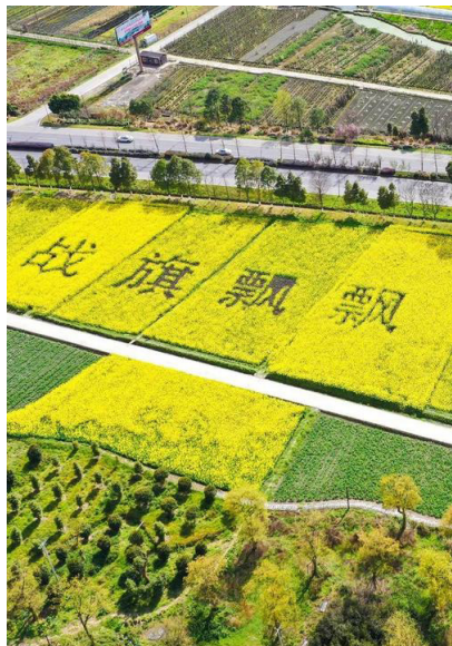
图1-3 成都战旗村乡村旅游

乡村旅游是指以农业(包括乡村文化)资源为对象的观光、度假、娱乐、康乐、民俗、科考、访祖等复合型旅游活动,包括观光农业旅游、休闲农业旅游和生态农业旅游。近年来,四川各地瞄准乡村振兴发展新机遇,以融合发展为抓手,把旅游业作为带动乡村发展的重要途径,围绕旅游全产业链持续发力,全省各地乡村旅游呈现百花齐放的发展态势,其中成都战旗村先后荣获“全国军民共建社会主义精神文明先进单位”“全国文明村”“中国美丽休闲乡村”“国家AAAA级旅游景区”“全国乡村旅游重点村”“四川省乡村旅游精品村寨”“四川集体经济十强村”等称号,如图1-3所示。