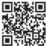
人物简介 “威廉·冯特”

构造心理学在心理学史上的积极意义在于使心理学摆脱了思辨的羁绊而走上了实验研究的道路，从而使心理学成为一门独立的科学。但是，这个学派所从事的“纯内省”的“纯科学”分析，严重脱离实际，并且清规戒律甚多，故遭到许多心理学家的反对而逐渐消失。