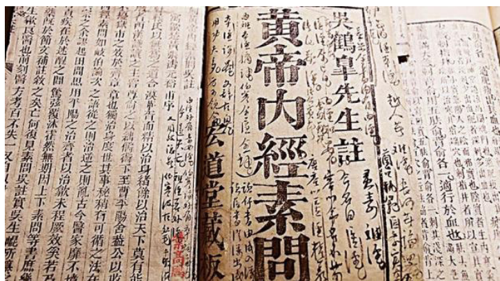
图 1-6 《黄帝内经》影印本

从源头祛病治本。中医治病除中草药之外，还有针灸、拔罐、刮痧、推拿等物理疗法。我们要自觉弘扬传统中医中药文化，为我国中医中药事业的可持续发展贡献自己的一份力量。中医的理论基础和源泉是《黄帝内经》（如图 1-6 所示）。