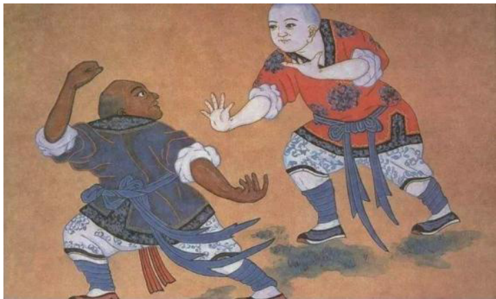
图 1-7 中国武术

中国武术又被称为中国功夫。中国武术有各种门派，如少林拳、武当功等。中国武术可以强身健体、防身自卫、修炼心性。中国武术主要包括搏击技巧、格斗手法、攻防策略和武器使用等技术（如图 1-7 所示）。