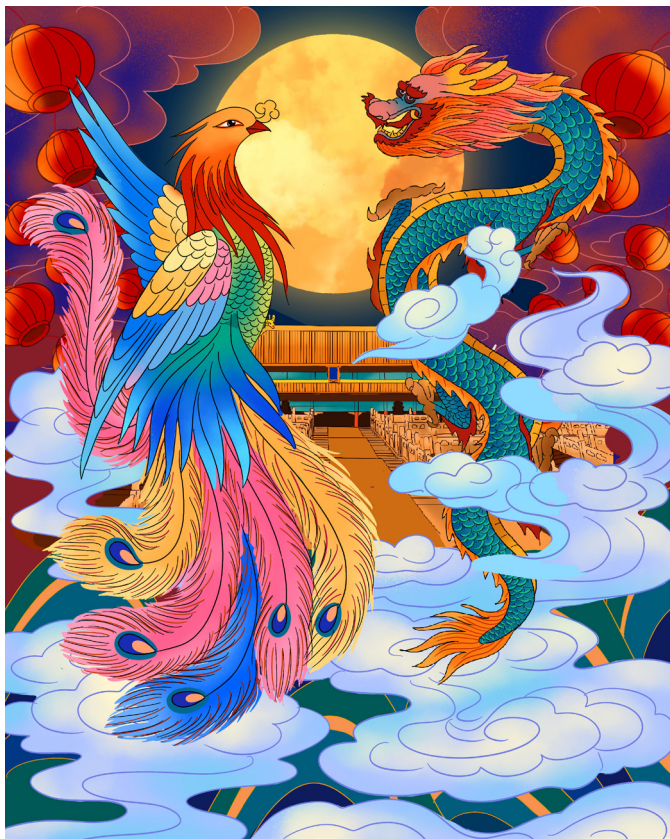
图 1-1 龙凤呈祥

代表祥瑞的图腾主要有龙、凤、麒麟、灵龟等。龙是中华民族的象征，龙也代表男性、皇权、阳刚。凤则代表女性、母仪和美丽。龙凤呈祥代表夫妻恩爱和谐（如图 1-1 所示）。