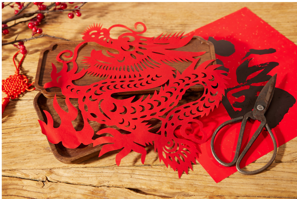
图 1-4 剪纸作品