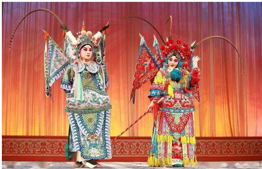
图 1-2 京剧《穆桂英大破天门阵》剧照

中国传统音乐戏曲主要包括：以传统乐器演奏的著名传统曲目，使用乐器主要有琴、筝、二胡、唢呐、笙、锣鼓等；各地各派戏曲，其特点是将文学、音乐、舞蹈、美术、武术、杂技及表演艺术综合而成，在共性中体现其个性。京剧、豫剧、越剧被誉为中国戏曲三鼎甲。其优秀代表作品如京剧《穆桂英大破天门阵》（如图 1-2 所示）。