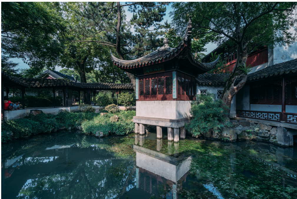
图 1-8 苏州拙政园