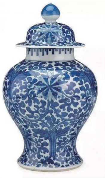
图 1-5 青花瓷

(3) 陶瓷文化：陶瓷不仅是生活器皿，也具有艺术文化特性。在我国古代文物中，陶器、瓷器占重要地位。其主流品种包括青花瓷（如图 1-5 所示）等。