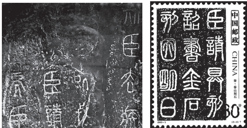
图 5-2 泰山刻石及其特种邮票