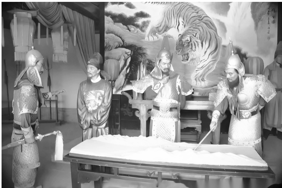
图 1-1 米盘

建武八年(34年)六月,来歙占领略阳,隗嚣溃败,刘秀趁势亲征,至漆县陇山之下,召开战前军事会议,诸将都认为王师亲征,事关重大,且前方情况不明,不宜深入险阻。刘秀一时犹豫未决,就想起马援这个“凉州通”,赶紧召他来军中议事。马援大胆创新,在世界战争史上首次使用了立体沙盘推演作业,确切地说,是“米盘”(图 1-1),即“聚米为山谷,指画形势,开示众军所从道径往来,分析曲折,昭然可晓”,从而明确汉军的最佳进军路线。结果,马援这极富想象力的天才创举,让汉军轻松穿越数处关隘,在巍巍陇山之中如履平地,打得隗军优势尽丧,苦不堪言。